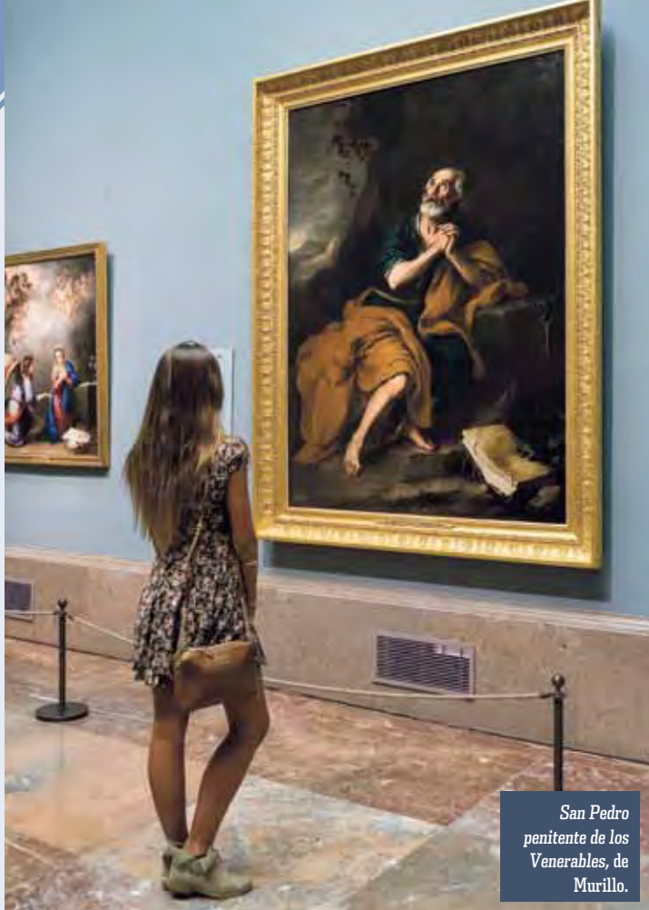
San Pedro penitente de los Venerables, de Murillo.