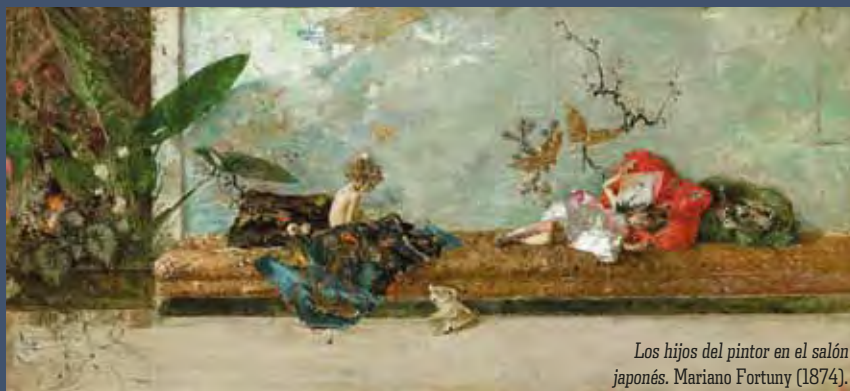
Los hijos del pintor en el salón japonés. Mariano Fortuny (1874).

El conocimiento de obras de otros artistas, sobre todo de Alonso Berruguete o Sebastiano del Piombo, ayudó a definir el estilo de un pintor que alcanzó temprana fama gracias a sus pequeñas tablas de temática religiosa. Con una marcada vocación comercial, Morales adaptó a la clientela de la época un producto artístico y devocional de factura muy cuidada que enlazaba con las tra-