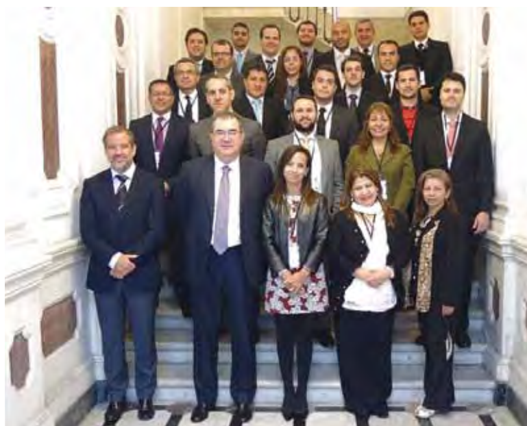
Los representantes de la delegación española junto con los alumnos asistentes al curso de derecho registral celebrado en Montevideo.

A la finalización de las clases en el Centro de Montevideo los alumnos se sometieron a un exigente examen de conocimientos que, en esta ocasión, superaron ampliamente todos los alumnos. Además del Certificado de Asistencia expedido por la AECID y fruto de la colaboración entre el Colegio de Registradores de España y la Universidad Autónoma de Madrid, los alumnos del Curso obtuvieron el codiciado Diploma