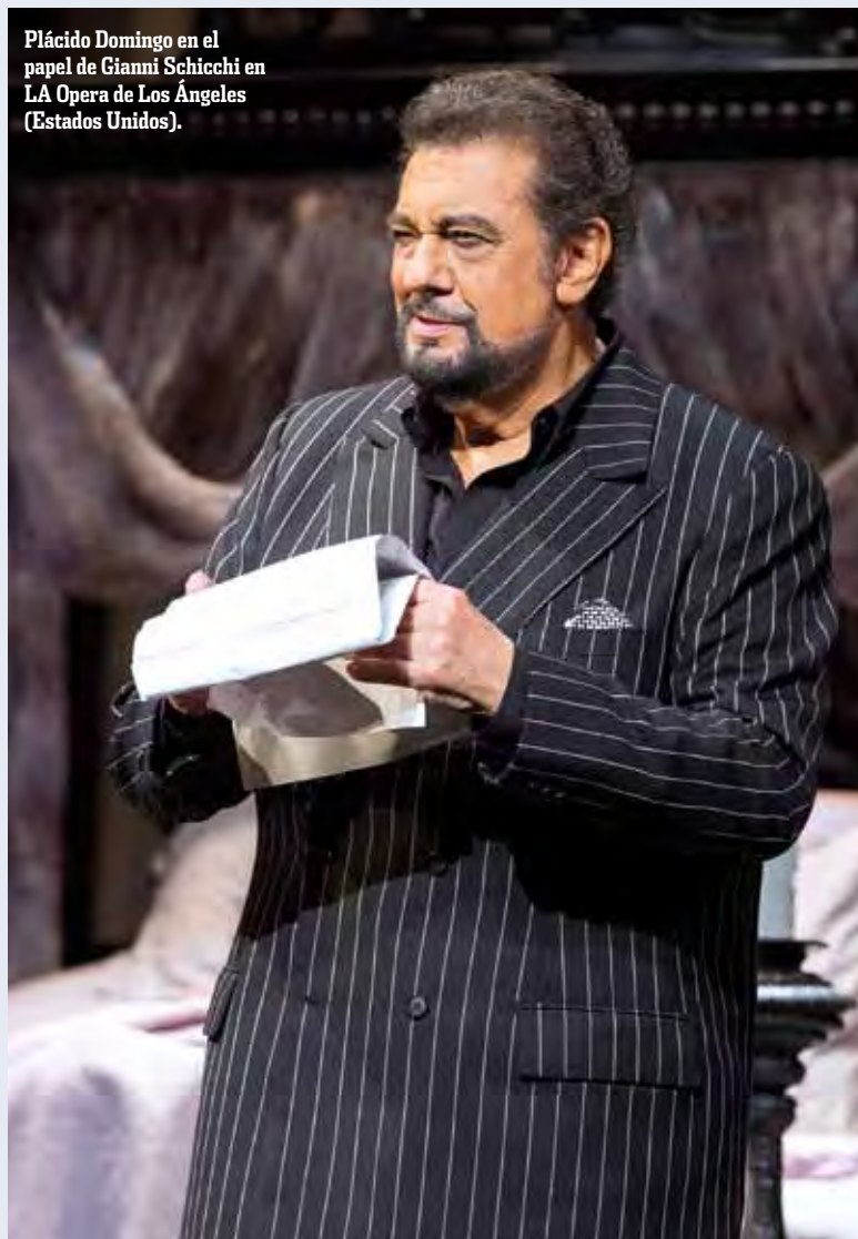
Plácido Domingo en el papel de Gianni Schicchi en LA Opera de Los Angeles (Estados Unidos).

partitura sino que no se permite un exceso más que para matizar siempre con adecuado tino. El paso de los años le ha hecho transitar con vuelta a su primitivo timbre y sí es cierto que no tiene el empaque y el color de un auténtico barítono pero, amigo lector, ¡cómo canta esos papeles! No es el quantum sino el quale , y ello unido a su talento para escoger los roles le lleva a seguir en el escenario donde se mueve como pez en el agua. La otra noche hizo lo que nadie