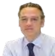
Alfredo Prada Presa

Presidente de la Comisión de Justicia del Congreso de los Diputados X Legislatura