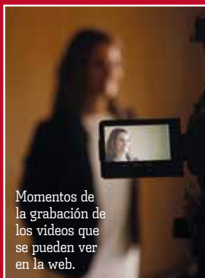
Momentos de la grabación de los vídeos que se pueden ver en la web.

REGISTRO ON LINE: dispone de su espacio en el árbol además de contar con una visibilidad propia en la cabecera de la página de inicio. ■