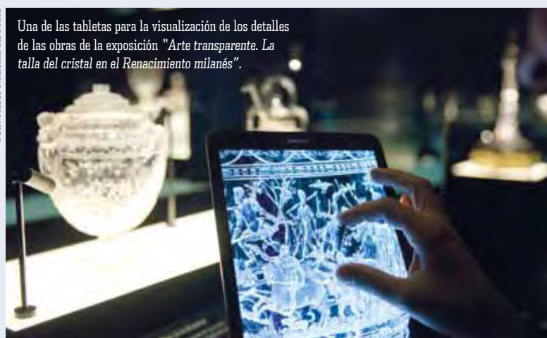
Una de las tabletas para la visualización de los detalles de las obras de la exposición "Arte transparente. La talla del cristal en el Renacimiento milanés".