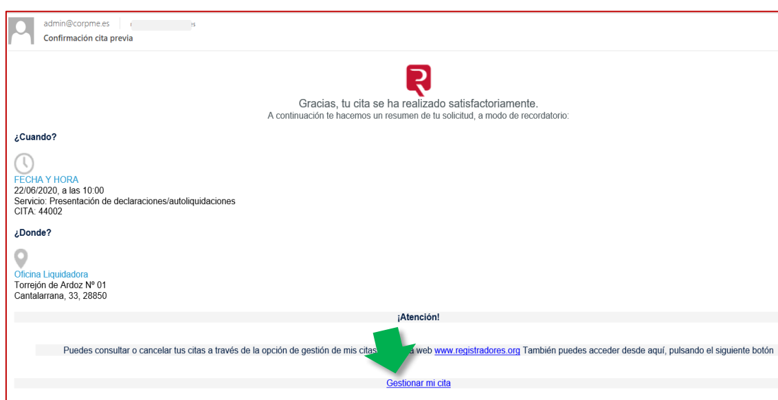
Correo con los datos de la reserva de la cita previa

El usuario recibirá en su correo los datos de la reserva de la cita para su gestión, desde el que se ofrecerá la posibilidad de cancelar la cita pulsando en su opción Gestionar mi cita