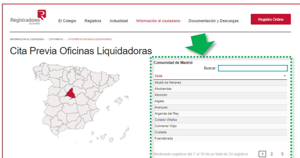
Oficinas de una Sede

Tras seleccionar la localización oportuna, se mostrará una relación de Sedes (oficinas) sobre la que elegiremos una haciendo click con el ratón sobre ella.