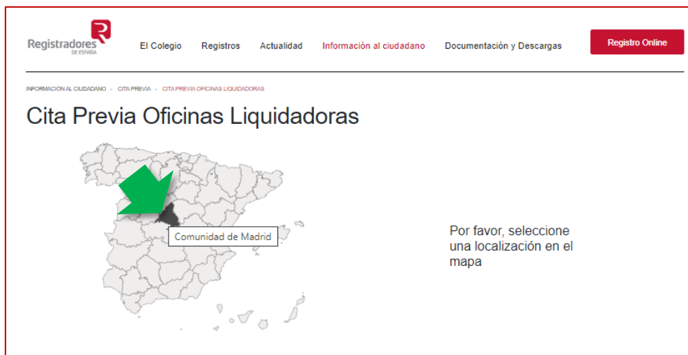
Solicitar cita previa en una Oficina Liquidadora de la Comunidad de Madrid

Tras pulsar en su opción, aparecerá la imagen del mapa de España sobre la que seleccionaremos la localización de la oficina en la que queramos pedir la cita.